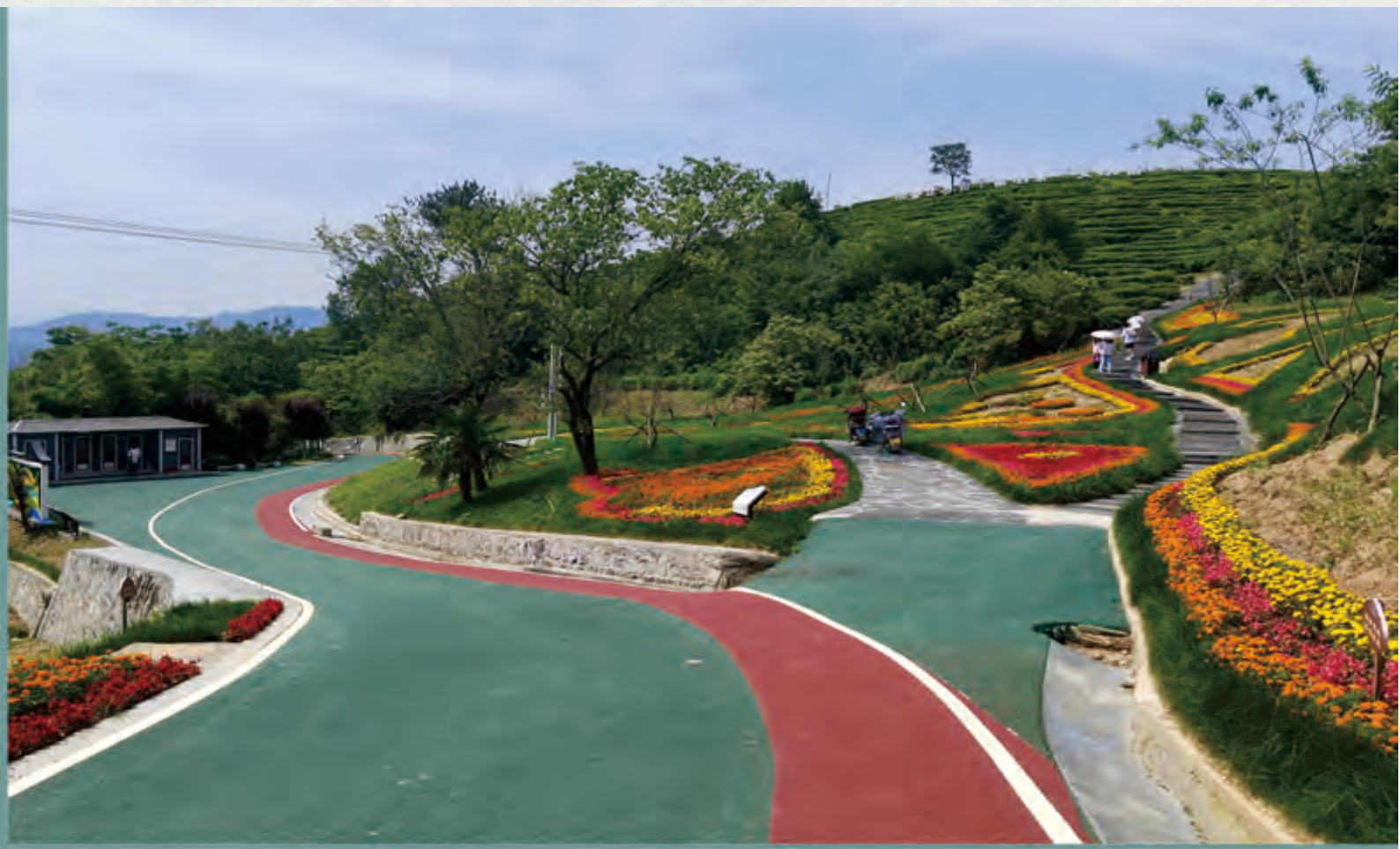
蒋家坪茶园新建的观景道及花坛。